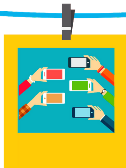
Hazlas tú mismo