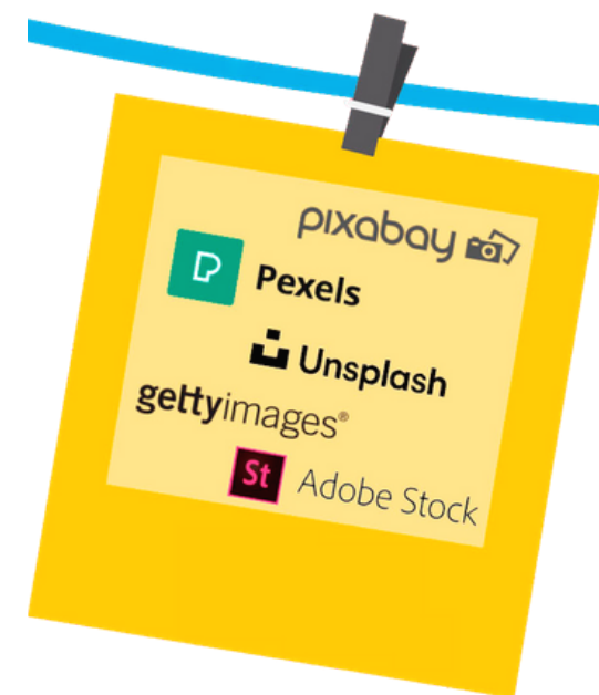
Bancos de imágenes